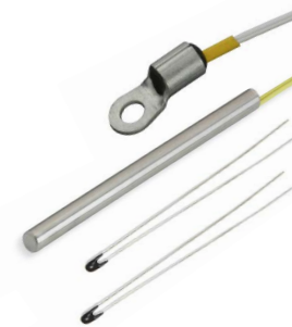
Sensores de temperatura