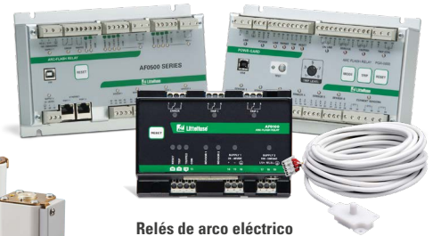
Relés de arco eléctrico